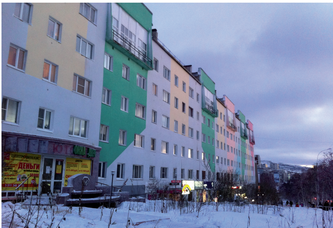
Zo kan het ook! Wat een kleurtje teweeg kan brengen.

Deze stad, ontstaan en gegroeid in Sovjettijd, heeft alle kenmerken van een plek waar werk aan de winkel is. De oude 'Chroesjtsjovflats' die zo kenmerkend zijn voor het stadsbeeld worden