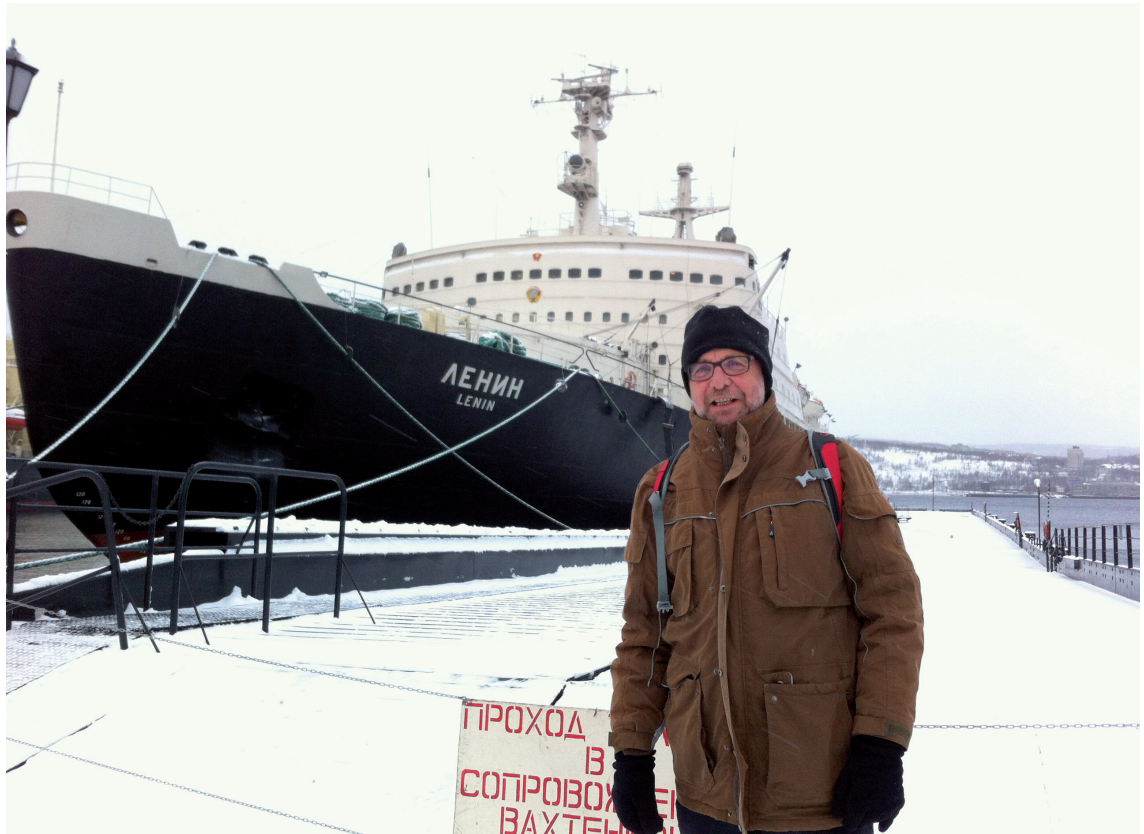
Jan Haijer voor de ijsbreker Lenin.