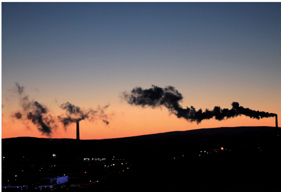
Uitzicht vanuit het kinderziekenhuis. Bij helder vriesweer gaat de rook omhoog. Bij mist is de lucht van olie herkenbaar.

op veel plaatsen in Rusland vervangen door nieuwbouw vanwege de vervallen staat waarin de gebouwen verkeren. In Moermansk is sprake van eenzelfde situatie als elders maar de renovatie gaat nog traag.