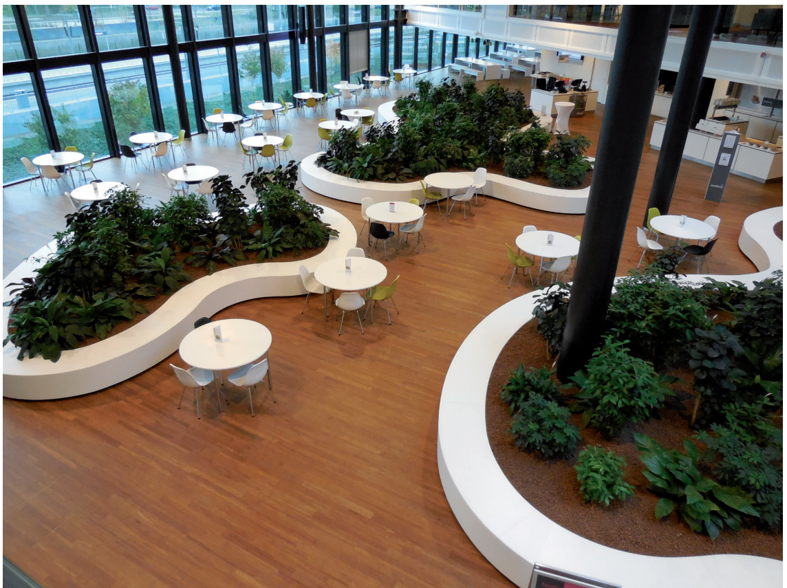
De nieuwe kantine

Het kantoor van de stedenband is verhuisd. Het hing al lang in de lucht: het kantoor van de gemeente aan de Europaweg gaat dicht.