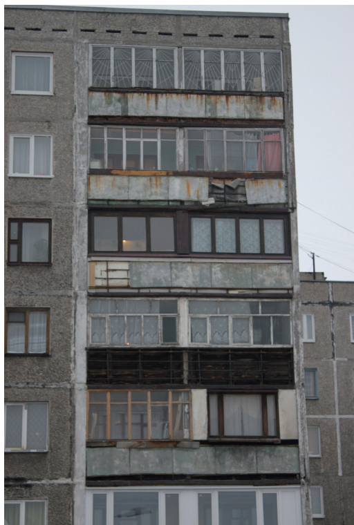
Flats die rijp zijn voor renovatie.